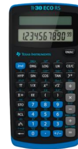
TI-30 ECO RS