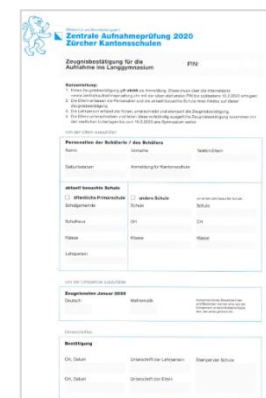
Zeugnisbestätigung für die Aufnahme ins Langgymnasium